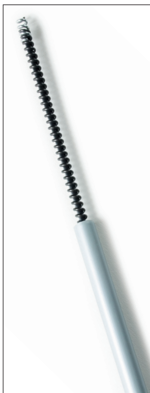
CABLE HELICOÏDALE CODE 30764A

Les éléments de transmission et les accessoires nécessaires pour une installation correcte sont les suivants: