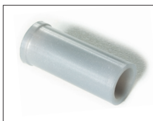
RACCORD DE GAINÉ

Il fixe la gaine au mur. Il faut installer un cavalier à chaque mètre et un avant et après chaque courbe.