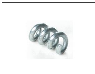
RESSORT DE FIN DE COURSE

Utilisé pour transmettre le mouvement du câble de la ligne principale aux lignes secondaires. Il est nécessaire pour les systèmes avec plus d'un verrouillage pour châssis à soufflet, fourches à rotule ou mécanismes à chaîne sur des fenêtres superposées.